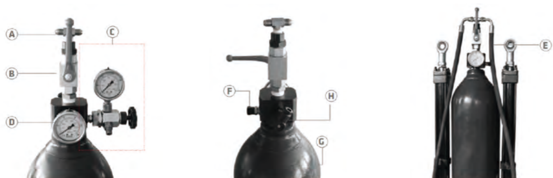
圖中紅色虛線框中之充、排氣閥 (C) 及其連接之充氣管 (E) 為選配部件,標準產品不含此兩項部件 (需另購)。

*This product be sold temporary in Mailand China.